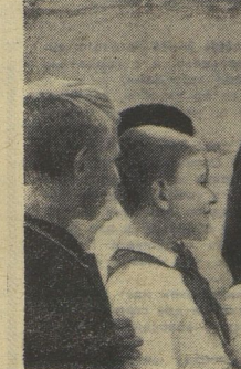
Павел Павлович беседует с юными тимирязевцами.

— Какую помощь мы можем оказать животноводам?