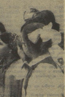
Павел Павлович беседует с юными тимирязевцами.

ПРЕЗИДЕНТ: У нас есть химические средства борьбы с сорняками, которые действуют избирательно, т. е. сорняки они уничтожают, а для культурных растений безвредны. При помощи химии мы боремся и с вредными насекомыми. Но последнее время учёные придают большое значение биологическим методам борьбы. Например, основным врагом огурцов является паутинный клещ. Но есть насекомое — фитосейлус, которое поедает паутинного клеща. Если в теплицу принести фитосейлуса, он уничтожит вредителя огурцов. Клеща фитосейлуса разводят специальные научно-исследовательские институты и сами колхозы. Враги наших врагов — это наши друзья. Будет такое время, когда фитосейлуса можно будет купить в специальном магазине.